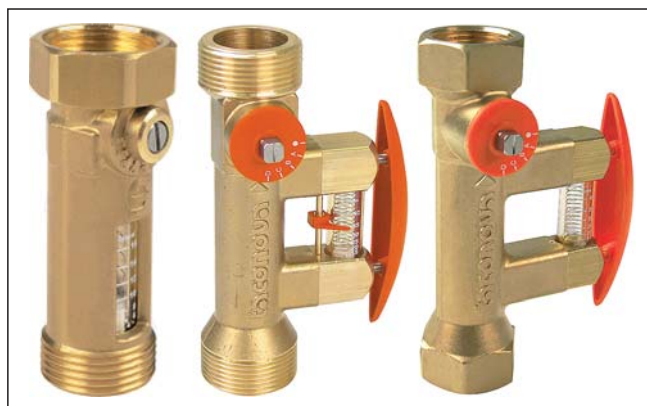
Obr. 2 Setter Inline UN, Setter Bypass SD Solar, Setter Bypass HT

Těm uživatelům, kteří chtějí ještě více využít sluneční energie na úkor konvenčních zdrojů, doporučujeme naši solární stanici Tacosol EU21 . V ní je běžné oběhové čerpadlo, napájené síťovým napětím, nahrazeno vysoce účinným čerpadlem Laing Solar, poháněným stejnosměrným proudem generovaným fotovoltaickým článkem. Toto čerpadlo má jedinečnou vlastnost, danou úměrou mezi intenzitou slunečního záření, velikostí generovaného proudu a výkonem čerpadla. Výkon čerpadla roste s intenzitou záření, a tudíž při vysoké intenzitě cirkuluje médium soustavou rychleji, což chrání kolektory před přehřátím. Naopak, při slabším záření je cirkulace pomalejší a umožňuje médiu, aby se v kolektorech dostatečně prohřálo. Samoregulační vlastnost čerpadla doplňuje přídavná elektronická regulace DC Control , jež prostřednictvím termočidel, umístěných na kolektoru a v zásobníku eliminuje nežádoucí jev, při kterém v časných ranních hodinách, kdy by médium vychladlé přes noc mohlo při předčasném rozběhu čerpadla ochlazovat vodu v zásobníku. Stanice Tacosol EU21 šetří další náklady za spotřebu elektriny pro čerpadlo a zajišťují dostatek teplé vody všude tam, kde například hrozí časté výpadky elektrické sítě.