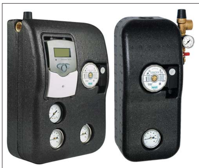
Obr. 1 Solární stanice Tacosol ZR a Tacosol ER

Navzdory současné nepříliš příznivé ekonomické i politické situaci se zdá, že program Zelená úsporám se po zjednodušení postupů při podávání žádostí o dotace a rozšíření rozsahu jejich využití konečně začíná plnit svůj zamýšlený účel. Švýcarský výrobce Ostaco AG nabízí řadu zajímavých produktů v oblasti solárního ohřevu, které v zahraničí i na našem trhu získaly množství příznivců a přispívají k efektivnímu a hospodárnému provozu, řízení a monitorování parametrů solárních soustav. I když jsme o většině z nich čtenáře Topln již v minulosti informovali, dovolujeme si touto cestou provést jejich krátkou rekapitulaci. Zásadní novinky v oblasti soláru, které naše společnost uvedla na trh teprve nedávno, představíme v nejbližších příštích číslech.